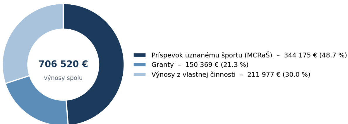
Graf 3 — Štruktúra výnosov roku 2025 podľa zdrojov

Poznámka: Pri skutočnom plnení boli menšie výnosové položky z účtovného denníka zaradené do vecne najbližšej rozpočtovej položky tak, aby celkový súčet zodpovedal výnosom vykázaným v účtovnej závierke.